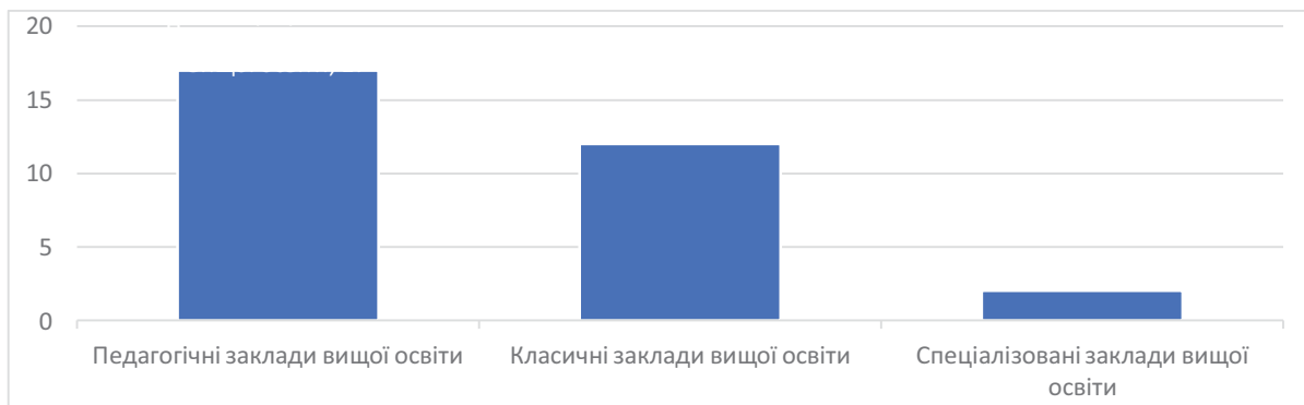
Рис. 1. Заклади вищої освіти, в яких здійснюється підготовка магістрів зі спеціальності «Середня освіта (фізична культура)»

Структурно державні заклади вищої освіти включають: 17 педагогічних університетів, 12 класичних університетів і 3 спеціалізованих університетів фізкультурного профілю (рис. 1).