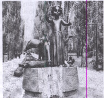
Пам'ятник знищеним у Бабиному Яру дітям