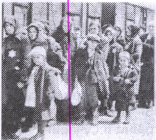
Вивіз євреїв до концтаборів