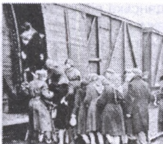
Вивіз українців на примусові роботи до Німеччини

Розкриваючи окупаційну політику нацистів, вчитель використовує прийом доведення та ілюстрації . Окупанти прагнули перетворити українські землі на постачальника продовольства та сировини. Так, через рік від початку нацистсько-радянської війни територію України було цілком окуповано німецькими військами та їхніми союзниками. Нацисти встановили так званий «Новий порядок», який відзначався ворожістю та жорстокістю. Окупанти закатували близько 5 млн. мирного населення та військовополонених з України. До Німеччини на примусові роботи було відправлено 2,4 млн. юнаків та дівчат, яких називали «остарбайтерами».