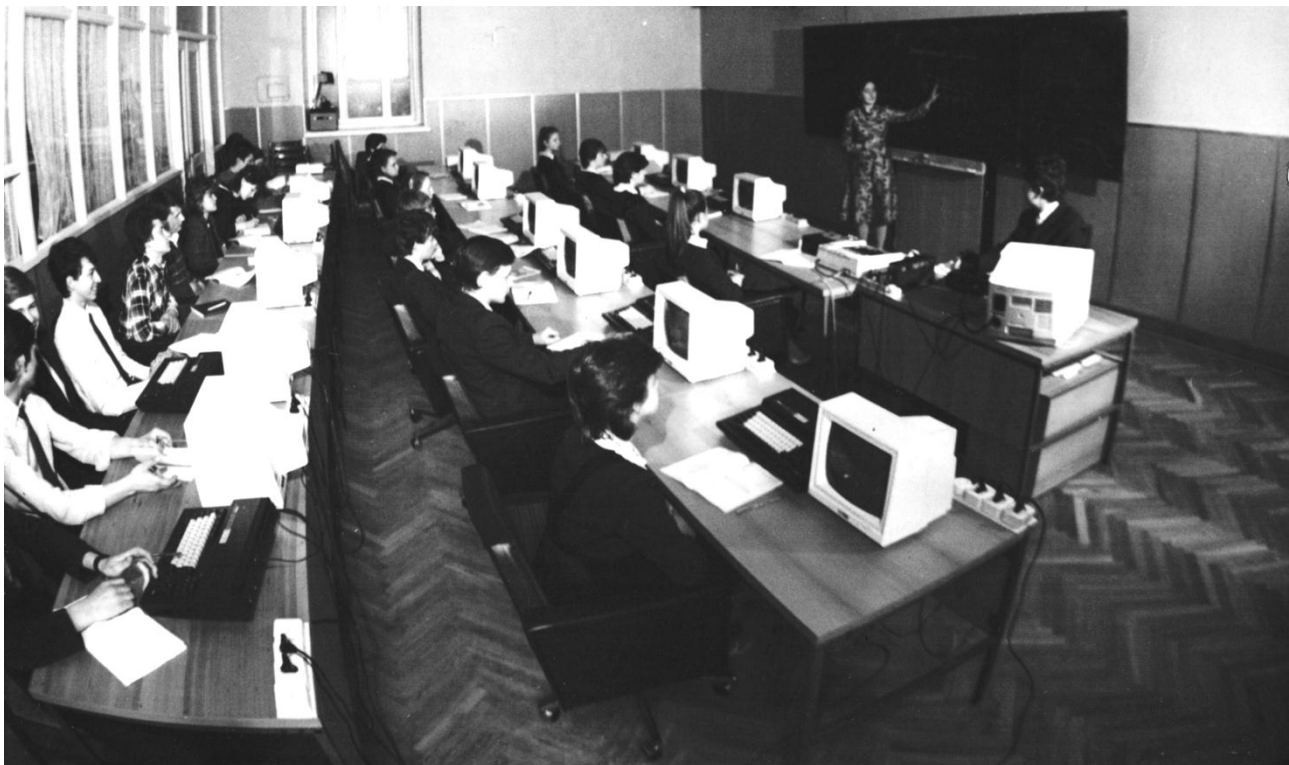
Фото 6. Клас мікрокомп'ютерів «Ямаха»