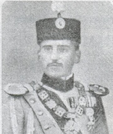
Спадкоємець сербського престолу королевич Олександр