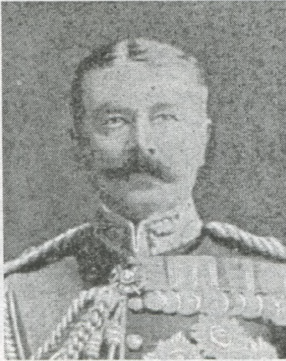
Фельдмаршал Кітчнер (англійський воєнний міністр)