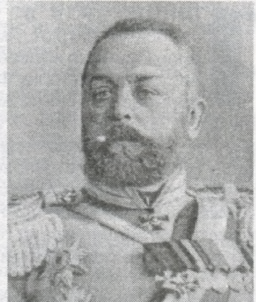
Генерал від кавалерії О.Самсонов