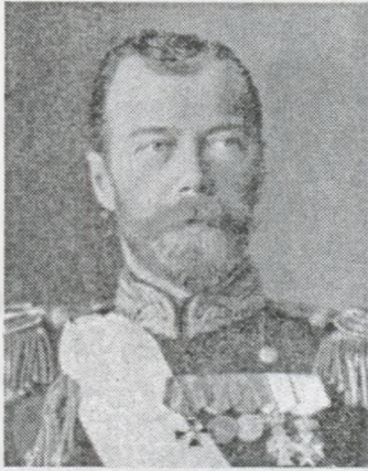
Російський імператор Ніколай II