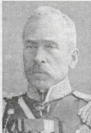
Командувач військами Варшавського військового округу генерал від кавалерії Я.Жилинський