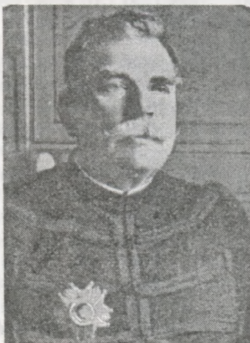
Головнокомандуючий французькими арміями генерал Жофр