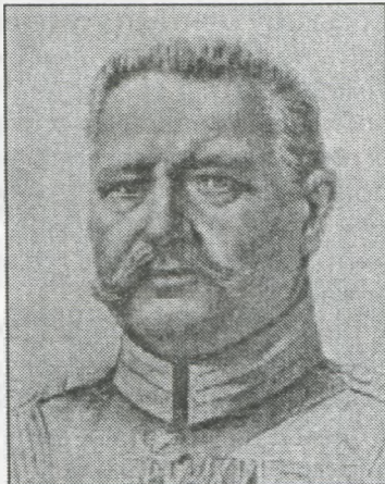
Фельдмаршал Гінденбург, керуючий операціями німецьких військ у Польщі