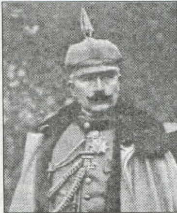
Німецький кайзер Вільгельм II (останнє фото)