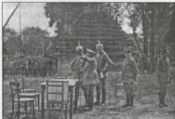
Імператор Вільгельм зі своїм штабом в районі Іпра