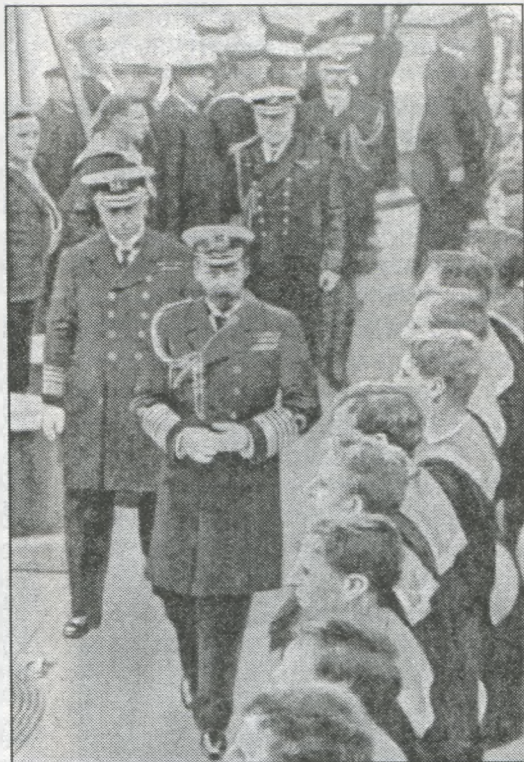
Англійський король Георг V обходить стрій моряків.