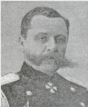
Командувач військами Віленського військового округу генерал від кавалерії П.Ренненкамф