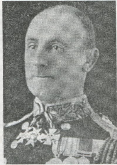
Головнокомандувач англійським флотом і начальник флотилії в Північному морі адмірал Джон Джеліко