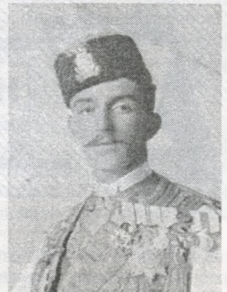
Спадкоємець чорногорського престолу королевич Данило