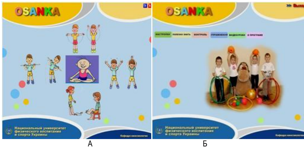
А – Головне вікно програми «Osanka» Б – Вікно програми «Osanka» – «Меню» Рис. 2. Основні вікна програми «Osanka», (роздрук з екрана монітора) [7]

Яскравим прикладом застосування мультимедійних інформаційних технологій в процес АФВ являється інформаційно-методична система «Osanka» [7] (рис. 2).