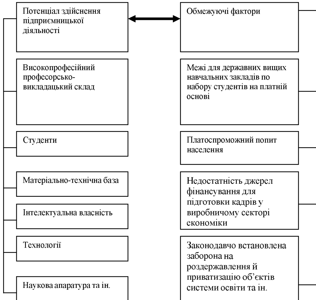
Рис. 2. Потенціал і межі здійснення підприємницької діяльності державних вузів

Це висококваліфіковані кадри професорів і викладачів, матеріально-технічна база, значна інтелектуальна власність, наявний парк наукової апаратури та ін. Поряд із цим існують обмежуючі чинники, що стримують розвиток діяльності, яка приносить прибуток. Серед них одним із суттєвих є законодавчо встановлений норматив набору студентів на платній основі.