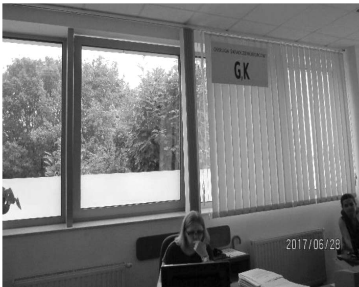
Рис. 3–4. Структурні відділи міського центру соціальної допомоги у м. Ярослав (Польща)