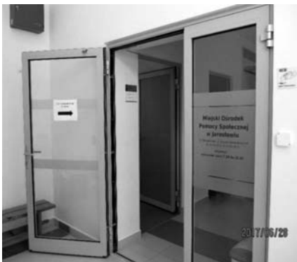
Рис. 1. Міський центр соціальної допомоги у м. Ярослав (Польща)