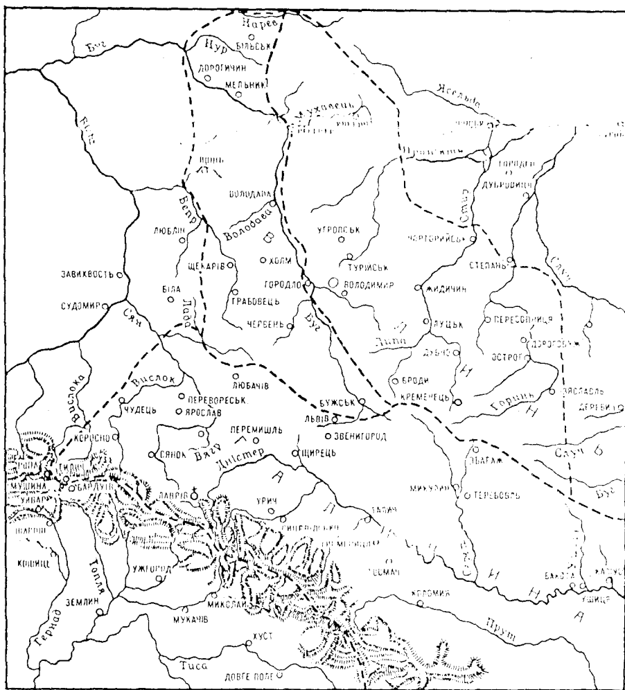
Галицько-Волинська держава XIII—XIV ст. (за М. Грушевським)

Зміцніла за цей час і Угорщина, яка поглинула Славонію, Хорватію, Болгарію, Валахію, Молдавію з Буковинною, а також українське Закарпаття. Саме Польща та Угорщина й почали активно зазіхати на роз'єднані західноукраїнські землі. 1340 р. угорсько-польські війська вдерлися в Галичину, оволоділи Львовом, та захопити увесь край не змогли. Запрошені Дедьком татари напали на Польщу й Угорщину і спустошили їх. Любарт поступово обмежував автономні права Галичини. У 1347 р. він остаточно її підкорив.