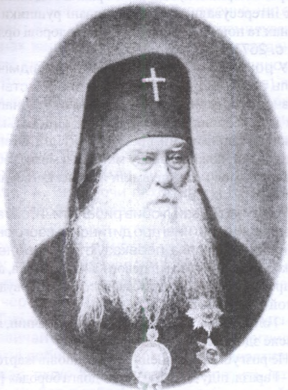
Архієпископ Херсонський Дмитрій

Природа стала основою для формування естетичних смаків та мистецьких зацікавлень. Рідні з дитинства пейзажі згодом розкриваються неповторними образами у творах прозаїка Нечуя-Левицького.