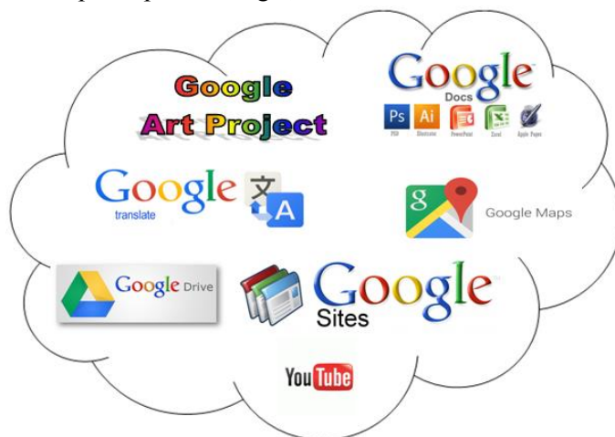
Рис. 1 Хмарні сервіси Google

Розглянемо детальніше хмарні сервіси Google, які показані на Рис. 1.