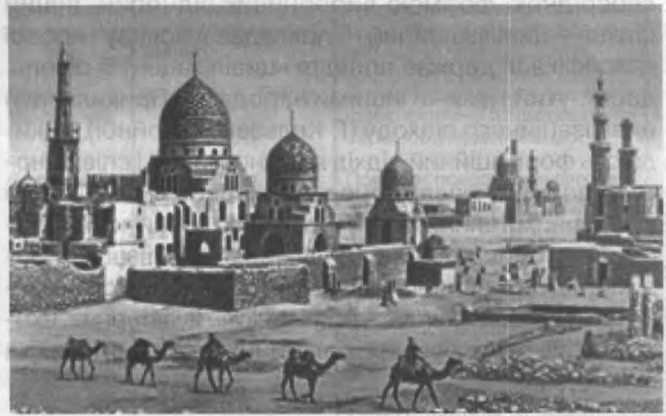
Історичні типи держав за цивілізаційним підходом (єгипетська, китайська, мексиканська, західна, православна, арабська та ін.)