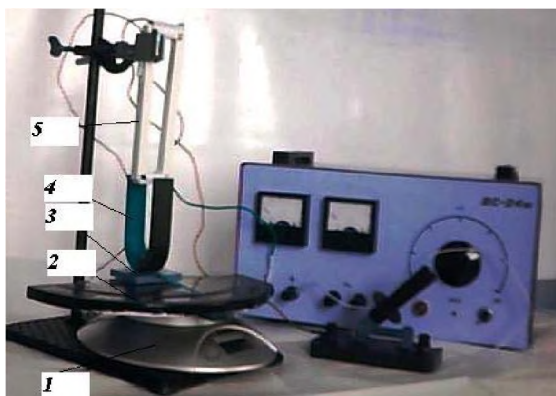
Рис. 2. Експериментальна установка для дослідження залежності сили Ампера від кута \alpha між вектором магнітної індукції та напрямком струму в провіднику

Провідні рамки можна застосовувати не тільки у демонстраційному експерименті, але і при виконанні лабораторних робіт. Діюча програма з фізики орієнтує вчителя з самого початку дати поняття індукції магнітного поля як величини, яка визначається силою, що діє на електричний струм у магнітному полі: F_A = BIl \sin \alpha . Найбільші труднощі виникають при спробі демонстрації залежності сили Ампера від кута \alpha між вектором магнітної індукції та напрямком струму в провіднику.