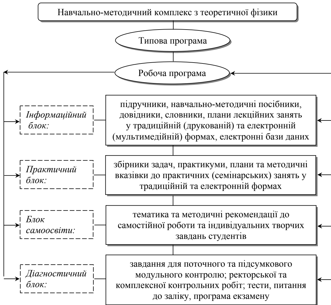
Рис. 1. Структура навчально-методичного комплексу з теоретичної фізики

виховна [8]. Визначений набір функцій ми розглядаємо в якості вихідного у розробці структури і функцій НМК з курсу теоретичної фізики.