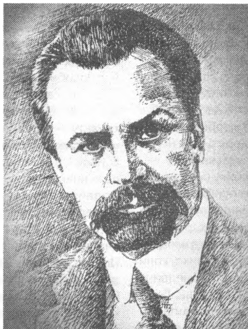
Володимир Кирилович Винниченко

І насамперед ці мемуари дають можливість пізнати складну і суперечливу особистісну сутність самого В. К. Винниченка, «реконструювати» його