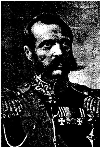
Цар Олександр II

Підсумовуючи сказане, зазначу, що М.І.Кибальчич, створюючи вибухові матеріали для терористичних актів, мав надію, що ці дії будуть виправдані тими позитивними реформами еко-