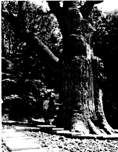
Історична пам'ятка: дуб Максима Залізняка

Що ж відомо історикам про головних ватажків Коліївщини 1768 р.? Зовсім небагато. Так, Максим Залізняк походив із селянської родини села Медведівка на Чигиринщині. Після смерті батька подався на Запорозжя, де довгий час був наймитом у козацької старшини. Поступово здобув авторитет серед простого козацтва, при цьому виявив неабиякі організаторські здібності. Незабаром довкола нього об'єднався гурт однодумців, які склали ядро повстання. Весною 1768 р. на одній із військових рад М.Залізняка було обрано полковником. Центром повстання стає Мотронинський Троїцький монастир, ігумен якого Мельхіседек Значко-Яворський під-