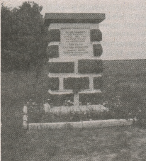
Пам'ятник на місці битви під Батогом