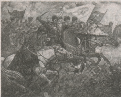
Битва під Батогом

Блискуча перемога, здобута гетьманом у битві під Батогом, засвідчила, що він урахував досвід Берестецької битви. Сучасники небезпідставно порівню-