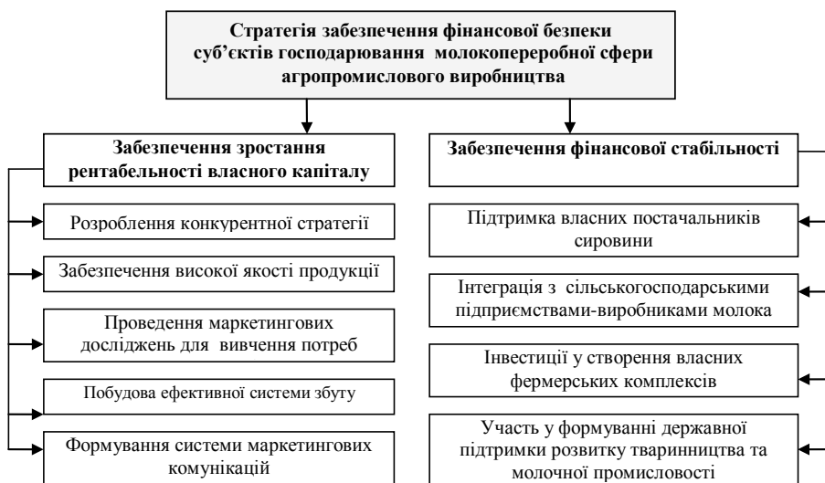
Рис. 4. Напрями реалізації стратегії фінансової безпеки суб'єктів господарювання молокопереробної сфери агропромислового виробництва

У розділі розроблено та обґрунтовано загальну схему комплексу заходів, необхідних для подолання найбільш значущих зовнішніх стратегічних загроз і реалізації стратегії фінансової безпеки суб'єктів господарювання молокопереробної сфери агропромислового виробництва, зокрема таких її складників, як стратегія зростання фінансової рентабельності ( означає отримання та збільшення чистого прибутку) та стратегія фінансової стабільності ( залежить від надійності постачання сировини) ( рис.4 ).