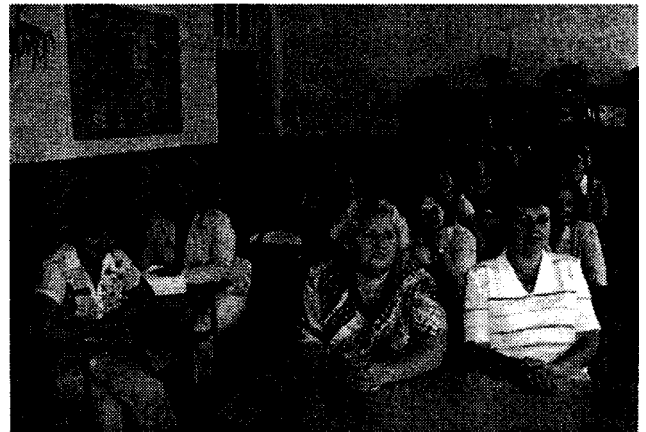
Учасники семінару «Підготовка вчителів у галузі громадянської освіти» на гостині в Лівадійській школі