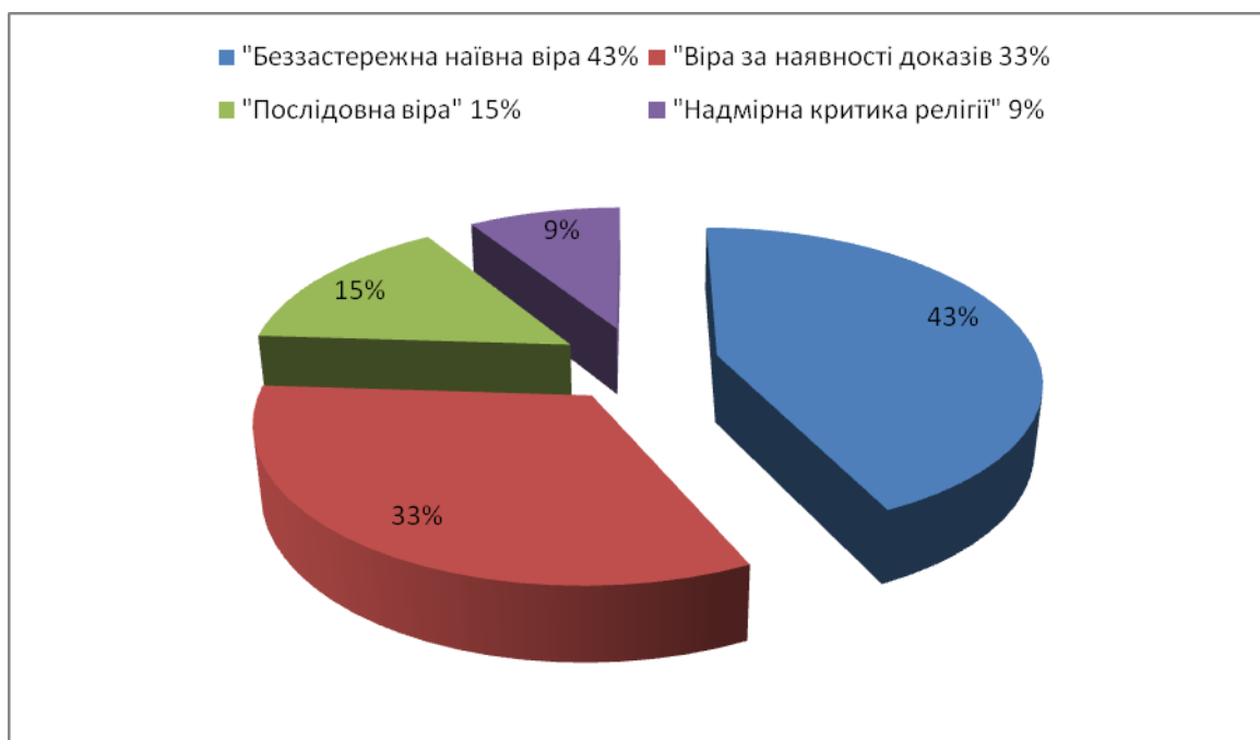
Рис.1. Розподіл результатів за методикою визначення релігійних вірувань Д. Хутсебаута

Згідно отриманих результатів, у більшості (43%) досліджуваних домінує шкала «Беззастережна наївна віра», яка виявляє віру у вищі сили за будь-яких умов і віру в усе, що вимагається релігією (див. Рис. 1).