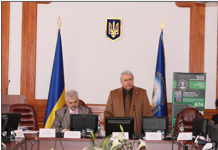
Вітання ректора НПУ імені М. П. Драгоманова учасникам Міжнародної наукової конференції “Восьмі юридичні читання” (10 жовтня 2012 р.)

Міжнародно визнаним та нормативно закріпленим Загальною декларацією прав людини (1948 р.) стало право людини на освіту, у п. 1 ст. 26 якої передбачається, що “кожна людина має право на освіту. Освіта повинна бути безкоштовною, принаймні, що стосується початкової та середньої освіти. Технічна та професійна освіта повинна бути загальнодоступною для всіх на основі здібностей кожного” [2]. У наступних актах міжнародного права, з урахуванням розвитку концепції права на освіту, були внесені істотні доповнення, що розкривають зміст і природу даного права, а також відповідні механізми його захисту.