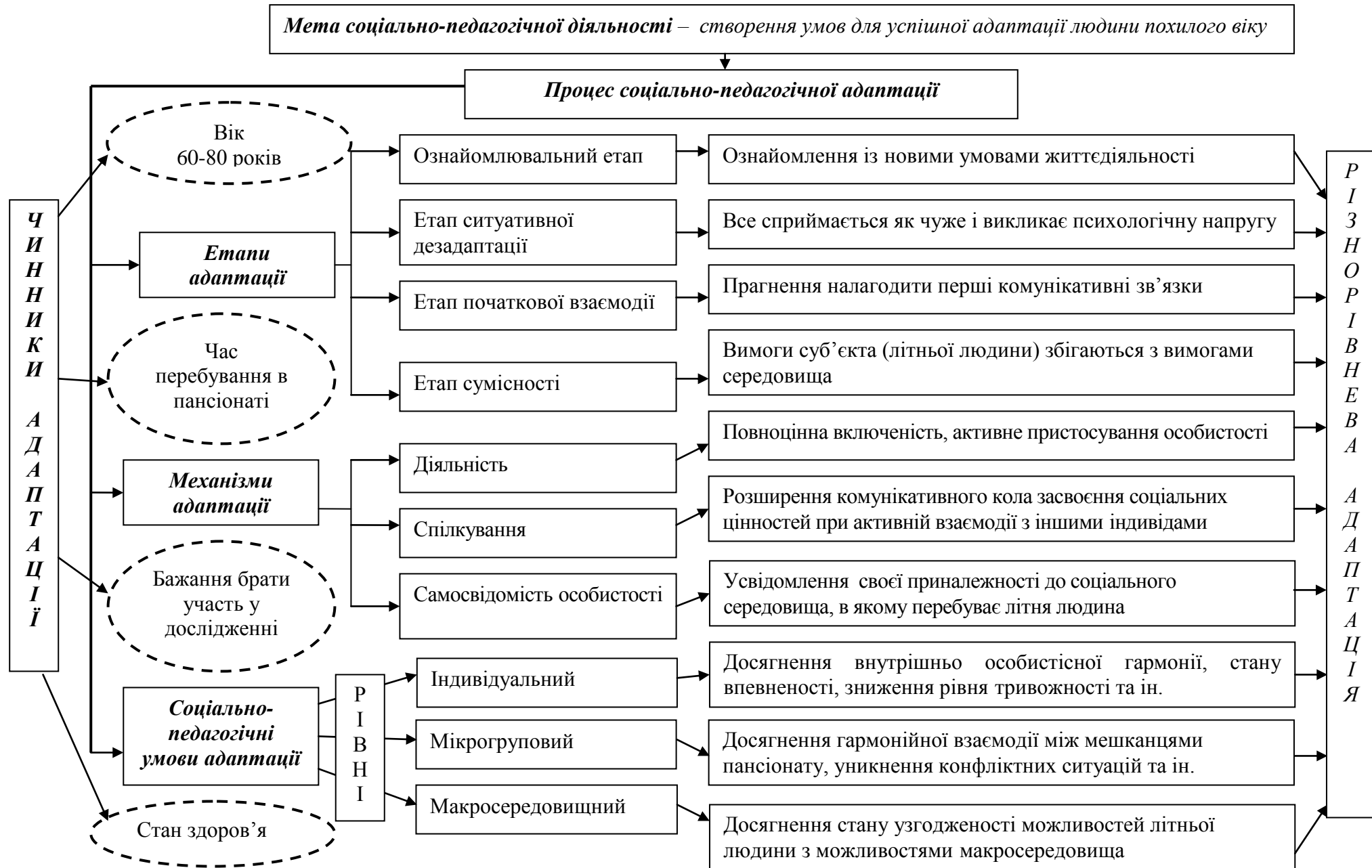
Рис.1. Модель адаптації людини похилого віку до умов нового соціального середовища (геріатричний пансіонат)